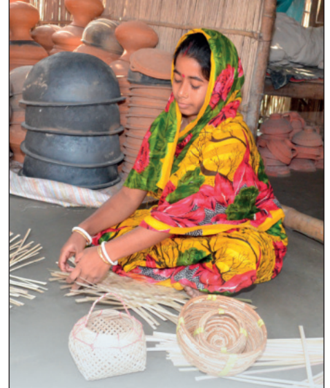
Kleinkredite und Schulungen ermöglichen den erfolgreichen Einstieg in das Korbflecht- und Töpferei-Geschäft.

Unsere Kleinkreditprojekte laufen in der Regel nach einer drei- bis vierjährigen Projektlaufzeit ohne externe Finanzierung weiter. Zurückgezahlte Kredite werden an neue Teilnehmer*innen verliehen und Sozialarbeiter*innen werden durch Ge-