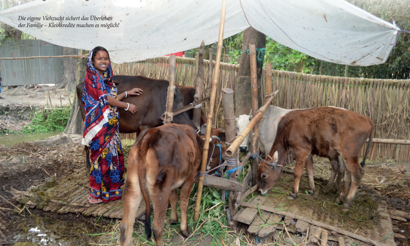
Die eigene Viehzucht sichert das Überleben der Familie – Kleinkredite machen es möglich!

bühren finanziert. Zwei Experten besuchen im Auftrag der Lichtbrücke zweimal im Jahr alle Kreditprogramme und stellen sicher, dass die Armen langfristig von diesem System profitieren.